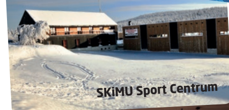
SKiMU Sport Centrum