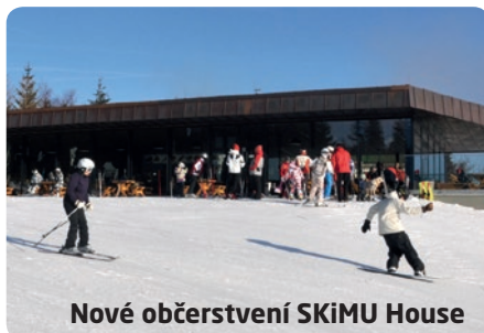
Nové občerstvení SKiMU House