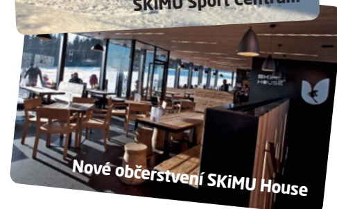
Nové občerstvení SKiMU House