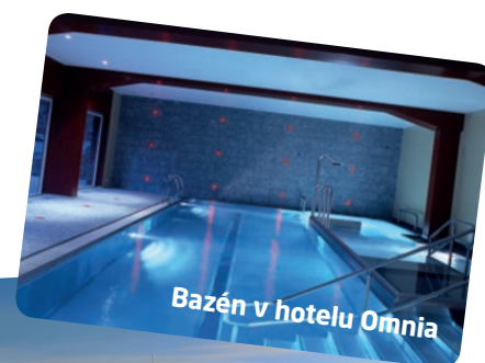
Bazén v hotelu Omnia