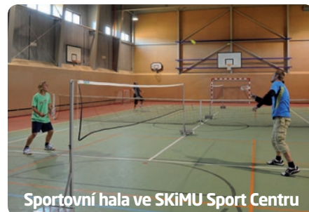
Sportovní hala ve SKiMU Sport Centru