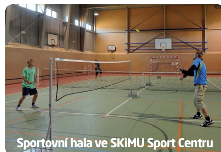
Sportovní hala ve SKiMU Sport Centru