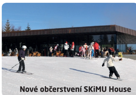
Nové občerstvení SKiMU House