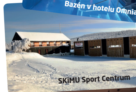
SKiMU Sport Centrum