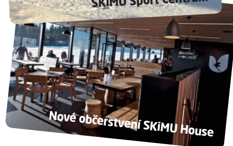
Nové občerstvení SKiMU House